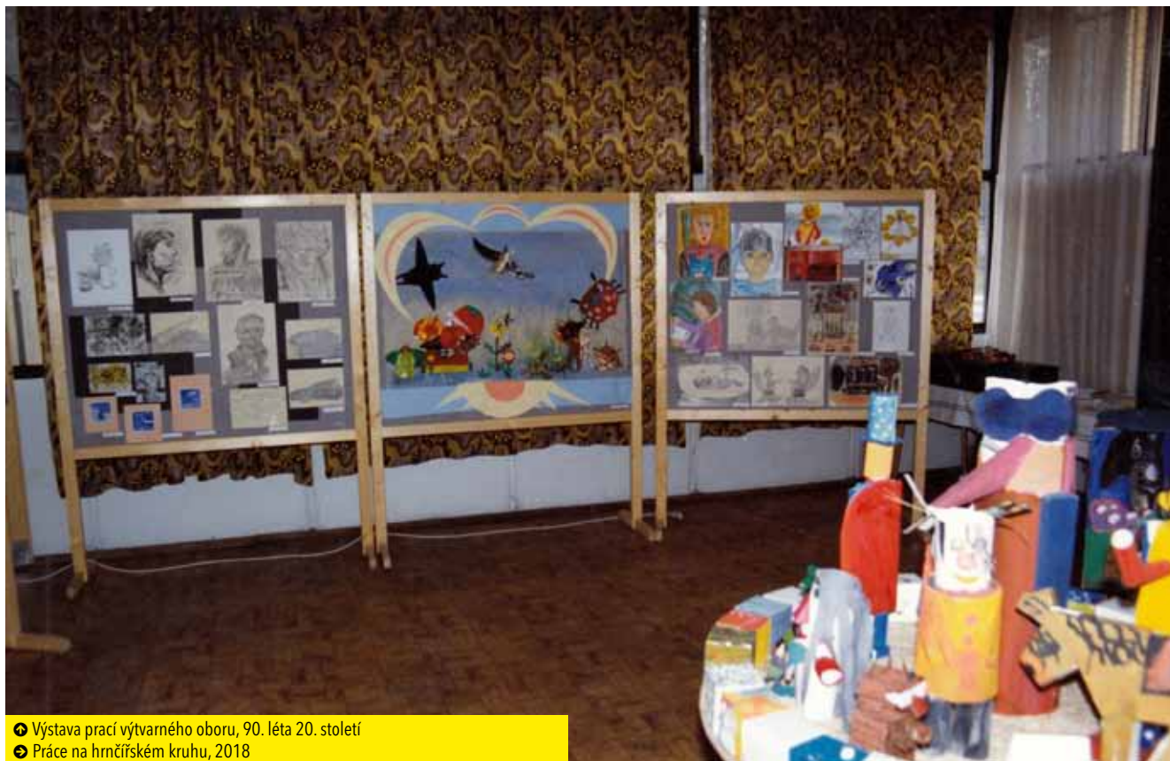
➤ Výstava prací výtvarného oboru, 90. léta 20. století ➤ Práce na hrnčířském kruhu, 2018