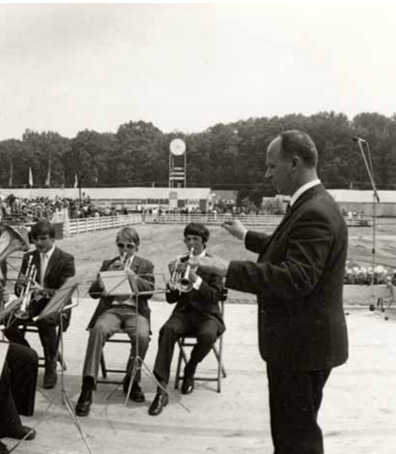
🕒 Velký dechový orchestr, 60. léta 20. století

1974 získává 1. místo v ústředním kole soutěže hudebních škol. V roce 1976 byl pozván na natáčení do Československého rozhlasu v Ostravě a v témže roce absolvoval úspěšný zájezd do německého Halle.